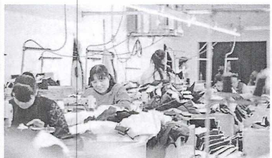
Las manufacturas es uno de los sectores que registró más crecimiento en la economía china, así como la minería y la construcción.