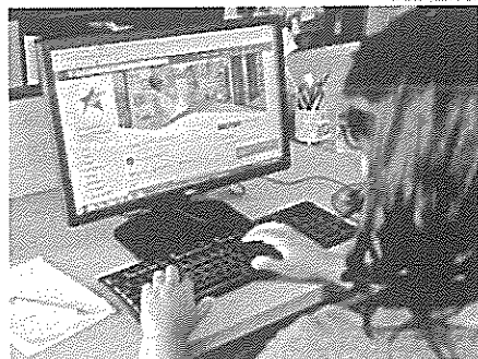
→ Para que los servicios de la banca avancen, a través de las redes sociales, necesitan que los clientes confíen en la seguridad que ofrece

Además, usarlas significaría un ahorro de operaciones. A una entidad le cuesta cerca de $ 3 atender a un cliente en agencia. En la red social el costo es cero. (1) (1)